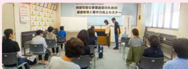
実技も交えながら教えていただきました

人手不足など厳しい経営環境を乗り越えるため、心身ともに健康で元気に仕事に携わろう! ということで、健康づくりの先生をお招きし、職場や自宅で簡単にできるエクササイズをはじめ、健康管理と集中力向上について勉強しました。