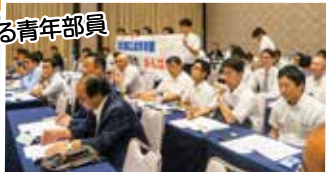
応援する青年部員