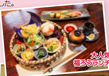
大人気! 福ろうランチ!

この秋には、小規模事業者持続化補助金を活用し、新メニュー・新サービスを開始する予定です。大将と女将さんの素敵な笑顔と、旬な素材と心を込めた逸品で、幸福な時間をお過ごしください。