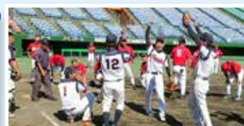
準決勝では抽選の末勝利した