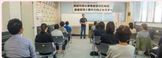
講師の先生の説明に真剣に聞き入る女性部員