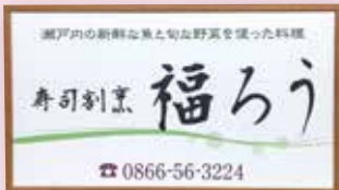
大きな看板が目印です