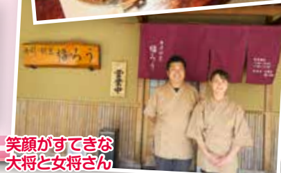
笑顔が素敵な 大将と女将さん