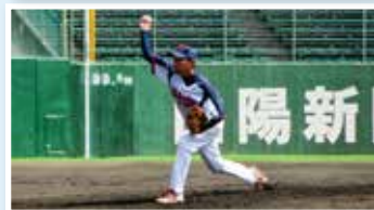
準決勝・決勝を2失点に抑えた投手陣