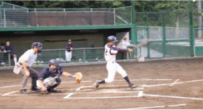
▲3回表、猛打を放つ備北商工会青年部チーム ＝6月27日(火)真備たけのこ球場

第52回岡山県商工会青年部親善軟式野球大会が10月11日(水)にマスカットスタジアムで行われます。今号は、青年部野球大会優勝を祈念して、野球にスポットを当てた特集記事をお届けします！